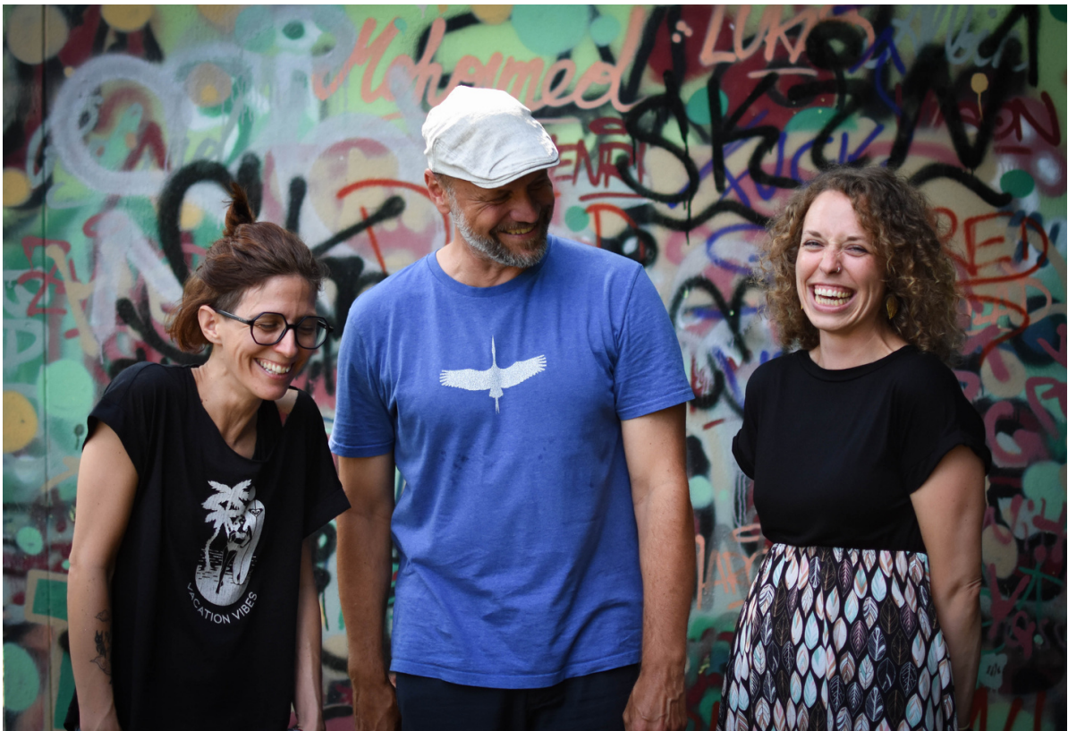
Team der Jugendberatungsstelle Neunkirchen und Schulsozialarbeit